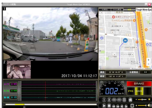
[2ch記録時の再生画面]

オプションカメラ入力(NTSC 信号)を備えており、オプションカメラのほか、バックカメラ等の映像信号を入力することが可能です。ドライバーや荷室の状況や車両後方の状況を記録することが出来ます。