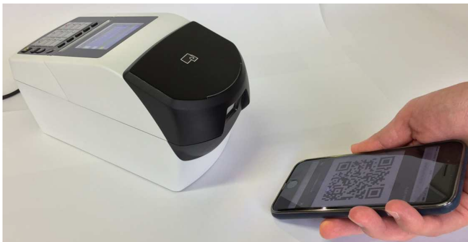
QRコードの読み取り